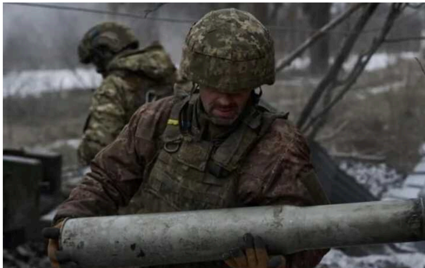
Ситуація на фронті: ЗСУ відбили позиції біля Авдіївки та полонили окупантів