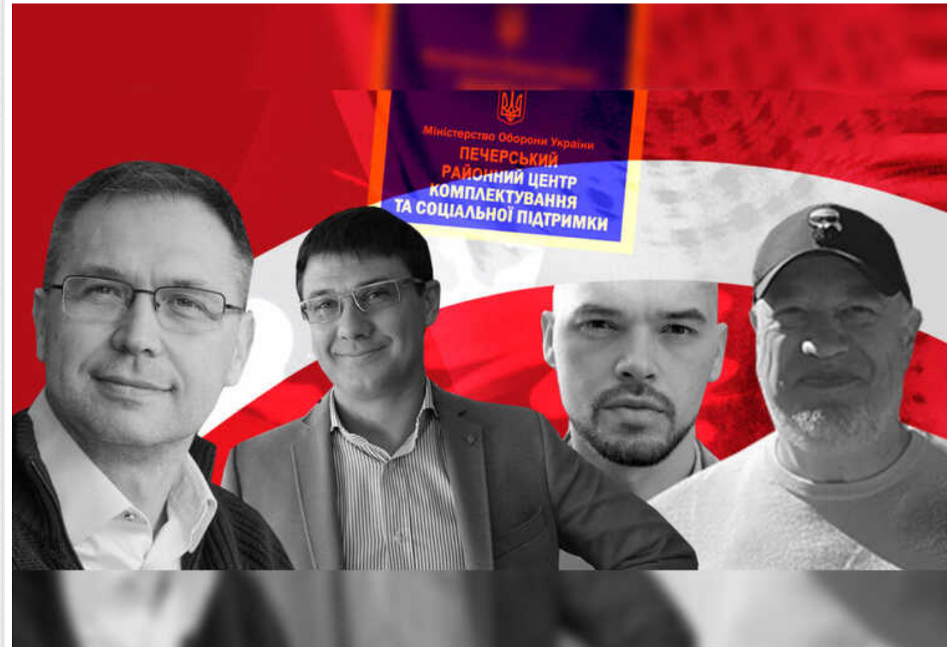
Столичний військкомат безпідставно зняв з обліку групу офіцерів запасу, які потім отримали нові військові звання

В Києві у Печерському військкоматі протягом 2022-2023 років безпідставно списали з військового обліку цюнайменше 24 офіцери запасу. Тепер вже непридатні до військової служби чоловіки мали звання від молодшого лейтенанта до майора.