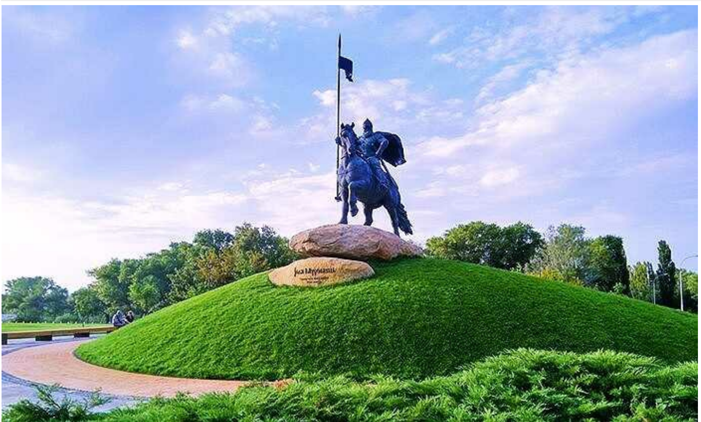
На острові Муромець гендиректор “Київводоканалу” та радник мера столиці привласнюють десятки заповідних гектарів

Під час розслідування Державного бюро розслідувань (ДБР) земельних махінацій в Х-парку на київському острові Муромець з'ясувалось, що земельні ділянки, які безкоштовно використовуються оточенням Віталія Кличка, були розділені на частки, а сусідні з ними – самочинно захоплені. Департамент земельних ресурсів КМДА підтвердив наявність земельної афери, але тепер намагається її приховати.