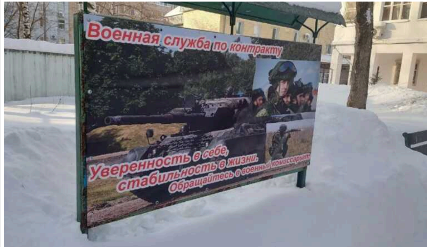
У російському Кірові на службу в армію закликають плакатом із танком Leopard

Країна-терорист Росія продовжує залучати до своєї окупаційної армії нове гарматне м'ясо. До того ж у місті Кіров місцевий військкомат навіть використав для цього німецькі танки Leopard.