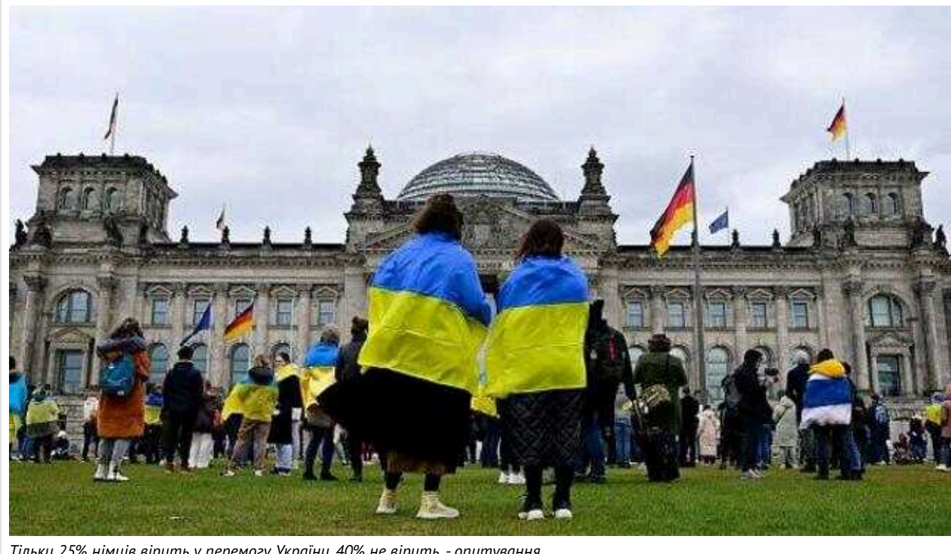
Тільки 25% німців вірять у перемогу України, 40% не вірять, - опитування

Результати опитування Ipsos публікує Deutsche Welle.