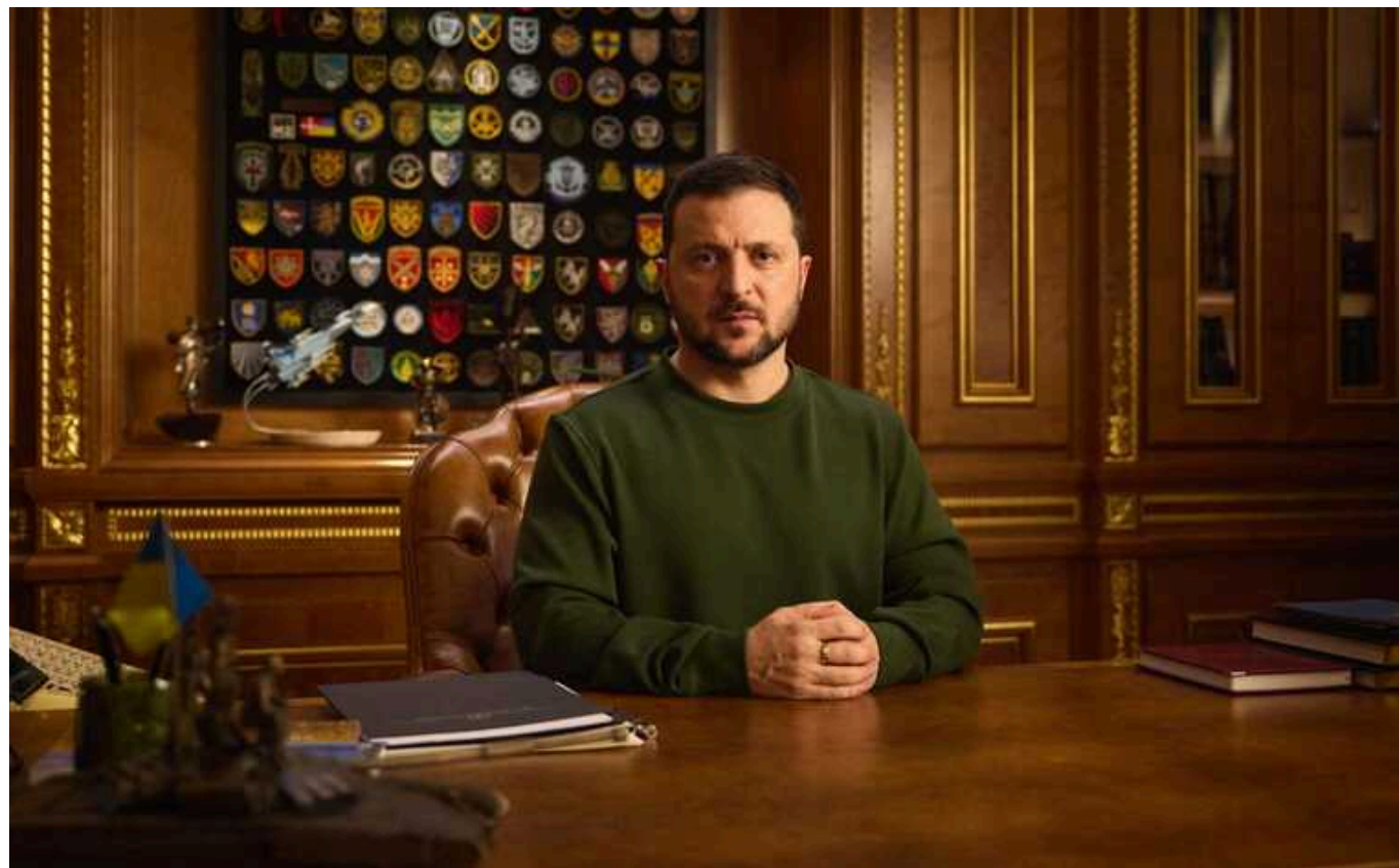
Наша мета – почати переговори до червня, - Зеленський про вступ України до ЄС

Мета України - розпочати переговори про вступ до Європейського союзу до червня 2024 року.