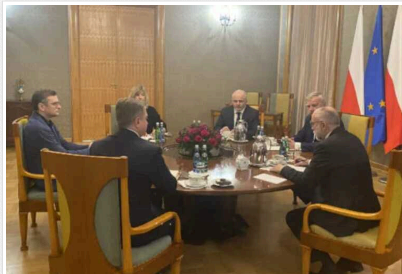
У Києва та Варшави є чітке розуміння, хто наш спільний ворог, - Кулеба після переговорів у Польщі

Міністр закордонних справ Дмитро Кулеба провів у Польщі переговори з керівником Кабінету Прем'єр-міністра Польщі Павлем Грасем і Головою Комісії у закордонних справах Сейму Польщі Павлем Ковалем. За їх результатами дипломат заявив, що у Києві і Варшаві є чітке розуміння, хто наш спільний ворог.