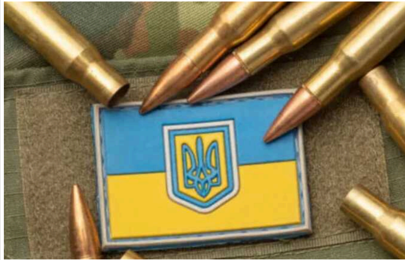
У ВР ухвалили закон: скасували заборону на прибуток для постачальників ЗСУ

У Верховній Раді ухвалили в цілому закон №10454 "Про оборонні закупівлі", який має вирішити конфлікт між Держаудитслужбою та бізнесом. А також удосконалили регулювання ціноутворення в оборонних закупівлях під час воєнного стану.