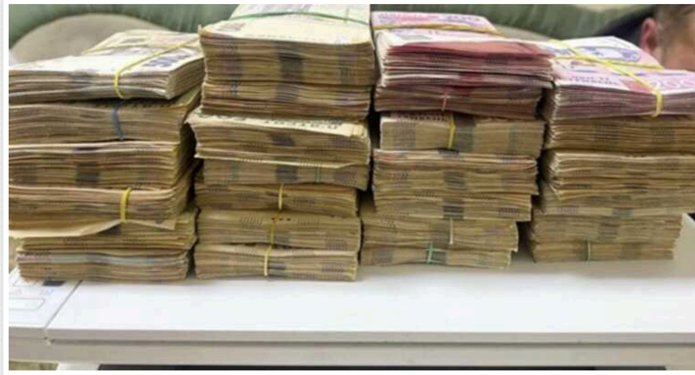
В Одеській області викрили держслужбовців Нацполіції у привласненні майже мільйона бюджетних коштів

На Одещині колишня очільниця фінансової установи разом із знайомою перевірили незаконну махінацію. Правоохоронці припинили схему нелегального збагачення.