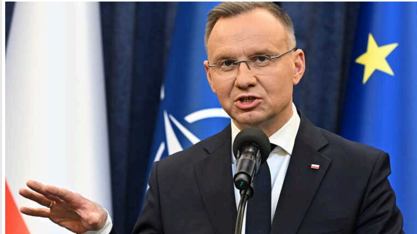
Шкода, що поляки висипають українське зерно на землю, але вони мають право на протест, – Дуда

Президент Польщі Анджей Дуда висловив жаль з приводу того, що фермери, які блокують кордон, нападають на транспорт з українським зерном і висипають його на землю. Проте водночас наголосив: поляки мають право на протест – особливо у світлі того, що вони бояться за своє існування, якому нібито загрожує українська агропродукція.