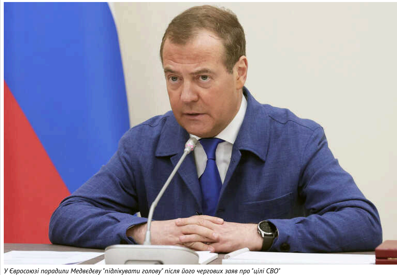
У Євросоюзі порадили Медведєву "підлікувати голову" після його чергових заяв про "цілі СВО"

Заступник голови Радбезу РФ Дмитро Медведєв заявив, що для "досягнення цілей СВО", військам РФ доведеться знову дійти до Києва, та зауважив що Росія вже "зачекалася Одеси". У Єврокомісії йому порадили полікувати психіку.