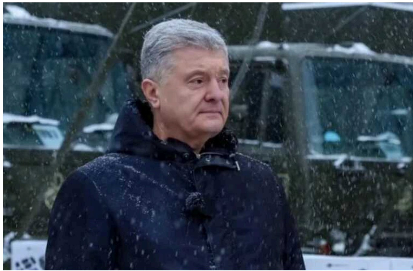
У ГУР майже пояснили, чому не випустили Порошенка на Мюнхенську конференцію з безпеки

До Головного управління розвідки (ГУР) регулярно надходять дані про потенційні загрози для українських державних та політичних діячів з боку Росії.