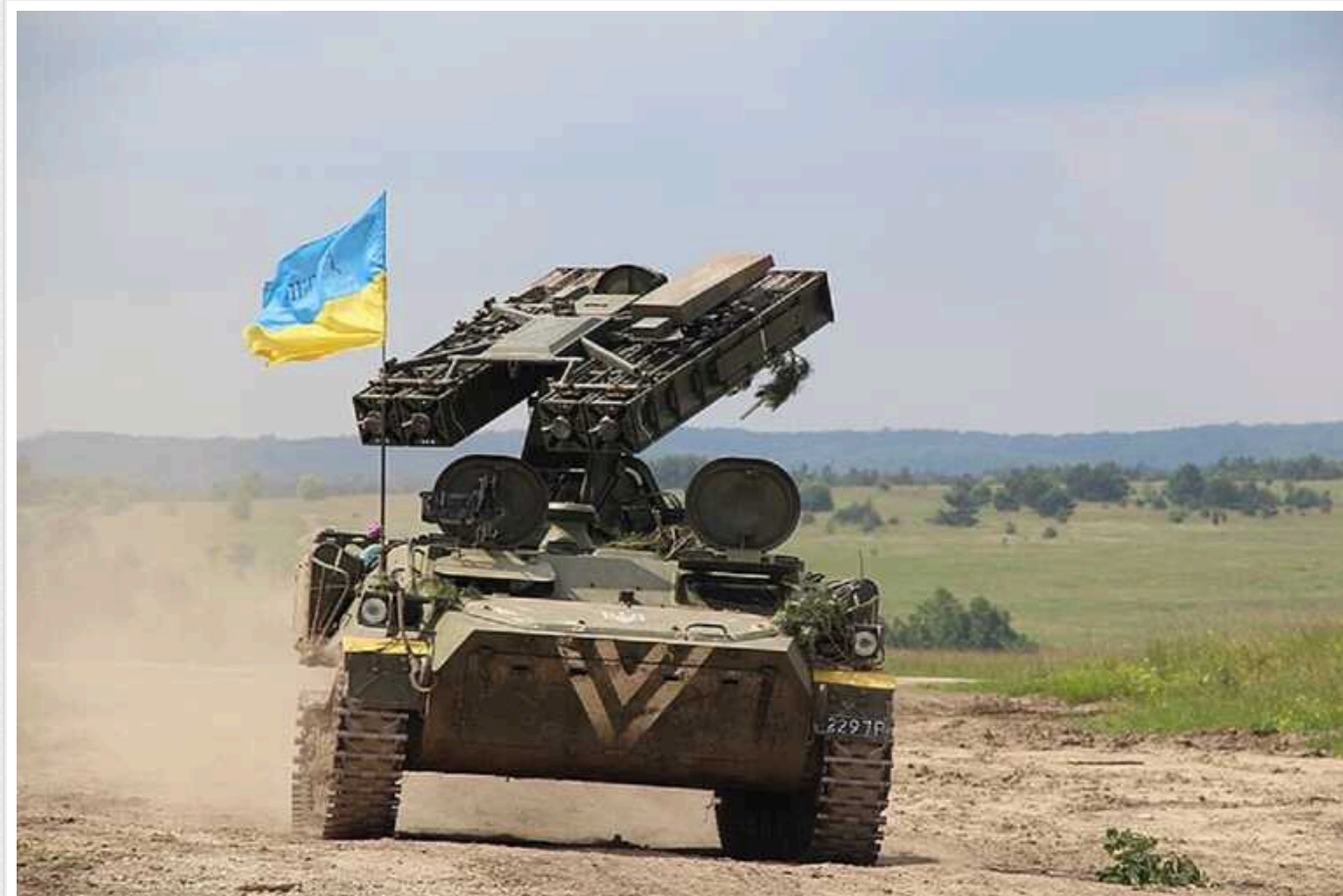
За внутрішніми оцінками США навесні Україна зіткнеться з потенційним "катастрофічним" дефіцитом боєприпасів та засобів ППО

Про це телеканалу ABC розповіли неназвані американські урядовці.