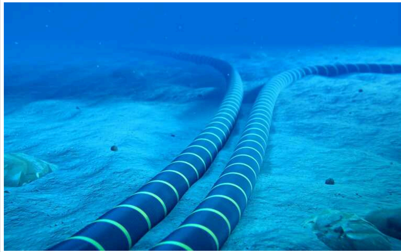
Глобальна мережа, через яку передається майже весь інтернет і фінансовий трафік, дуже вразлива для саботажу, - Bloomberg

Росія вже почала досліджувати підводну інфраструктуру Атлантичного океану.