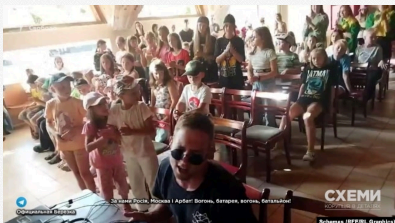
Схема/Росія, Росія і Арбат Вітолом, Батарей, вогонь, Батарейні

Для українських дітей у таборі «Берюзка» проводили розважальні заходи, під час яких діти переводжалися у військову форму країни-агресорки, виконувалися проросійські воєнні пісні гурту «Любе».