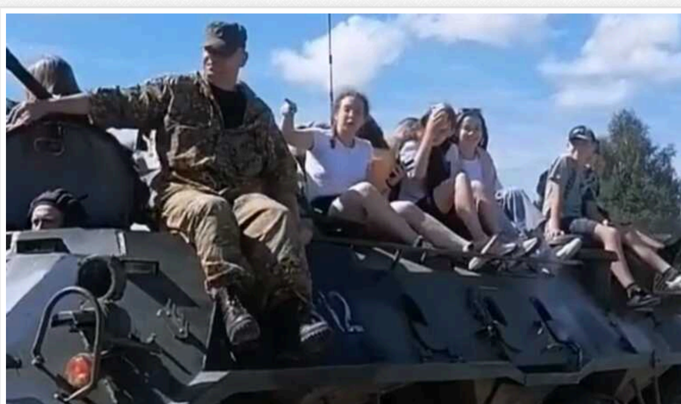
«Відпочинок» українських дітей в «ідеологічних» таборах Білорусі у 2022 році співфінансував фонд ООН ЮНІСЕФ

Дітей із новоокупованих Росією територій України возили в Білорусь у дитячі літні табори «для реабілітації», при цьому програма так званого відпочинку включала в себе аітаційні заходи, спрямовані на викоринення української ідентичності, ментальну і культурну асиміляцію з Росією. Організацією таких поїздок у 2022-2023 році опікувався Білоруський Червоний Хрест і Фонд паралімпійця Олексія Талая. А в 2022 року цю програму також співфінансував Дитячий фонд ООН ЮНІСЕФ.