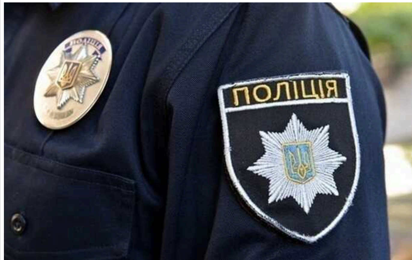
У Києві теща повідомила поліцію, що її зять підтримує армію РФ, і суд відправив його до в'язниці

У вироку йдеться, що на початку травня 2022 року чоловік перебував на дачі теці в селі Дзвінкове Київської області. У присутності теці, свого сина та ще двох людей він сказав: - Це самообман укрофашистів, і взагалі в Росії все набагато краще. Якби не такі бандери, як ми, то тут давно була б Росія і наводила б свої порядки і привчала б до правильних звичок укрофашистів».