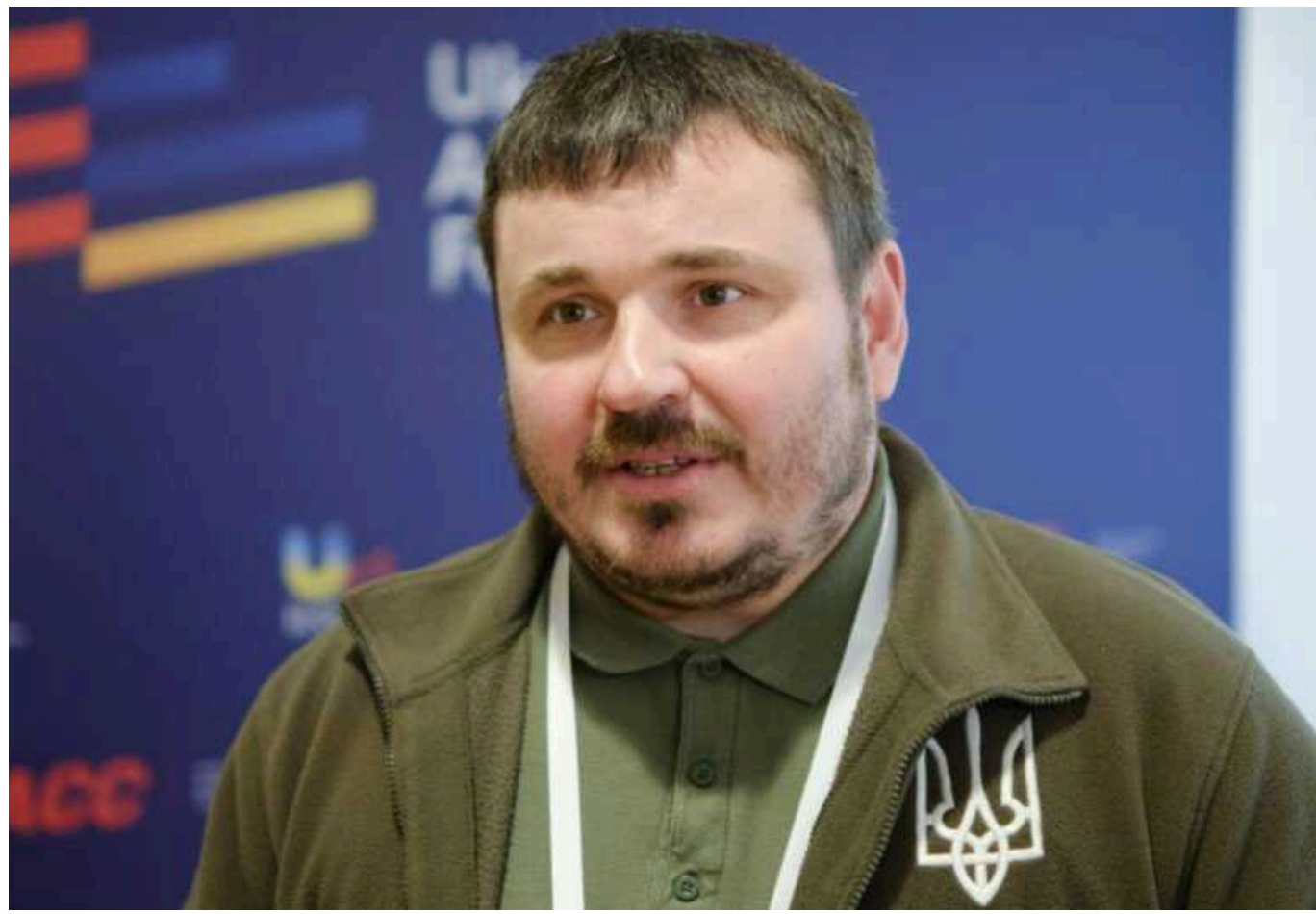
Президент призначив ексглаву Укроборонпрому Юрія Гусєва послом в Азербайджані

Президент Володимир Зеленський призначив колишнього керівника "Укроборонпрому" Юрія Гусєва послом України в Азербайджані.