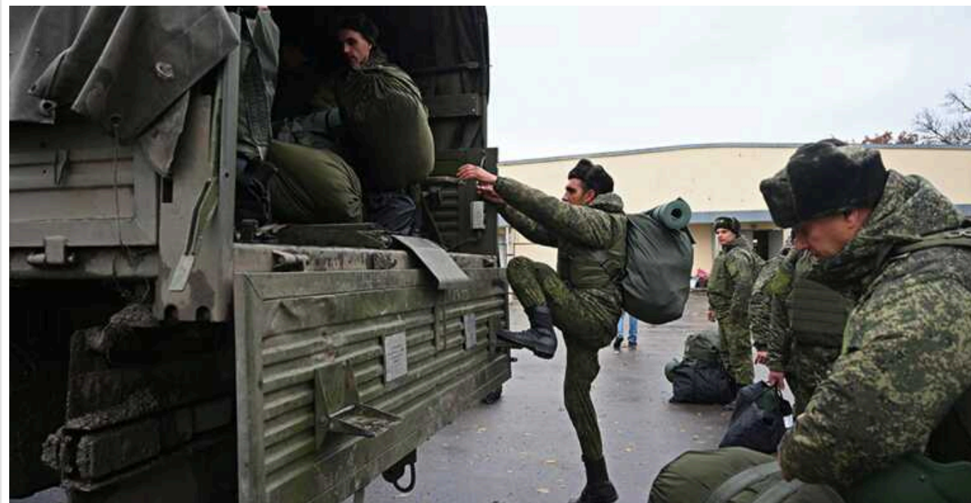
ISW: ЗС РФ наступає на східний берег річки Оскол на Харківсько-Луганському напрямку

Армія РФ проводить "згуртовану багатосторонню наступальну операцію" на харківсько-луганському напрямі, пише американський Інститут вивчення війни.