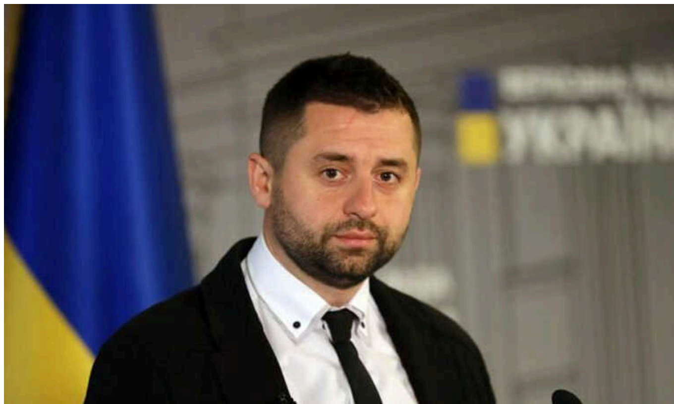
"Якщо допомоги від США не буде або вона буде меншою за обіцяну, то мобілізувати потрібно більше українців", - Арахамія

"Якщо буде допомога менша, нам треба більше мобілізувати людей. Якщо допомога буде більше, тоді коефіцієнт озброєності зростає і тоді вам треба менше людей, тому що ви можете деякі ділянки фронту закривати умовно зброєю, і вам не треба стільки людей", - заявив Арахамія.