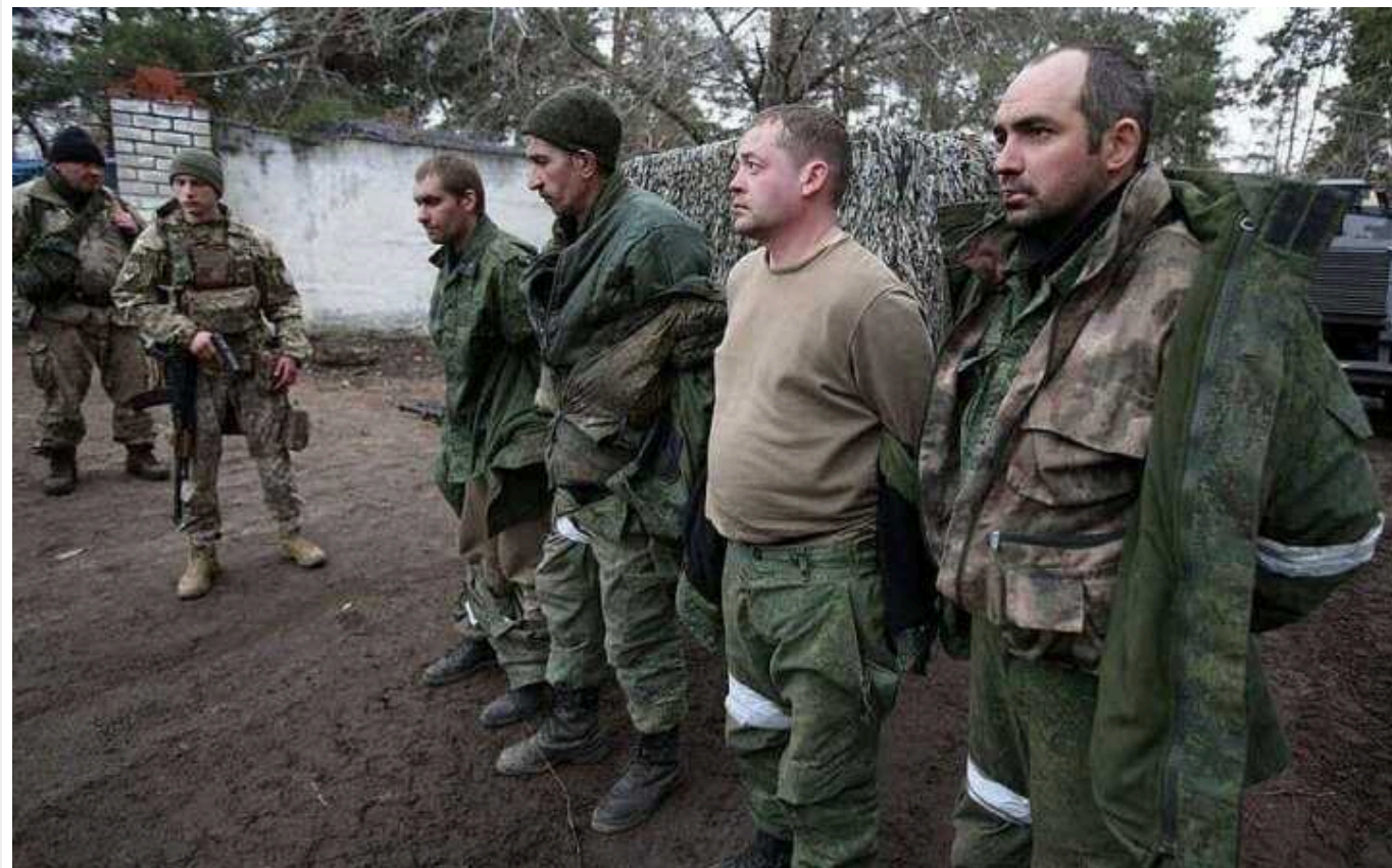
Як утримують російських полонених в Україні, які здаються у полон сотнями

Сотні російських солдатів здалися у полон ЗСУ через проєкт Координаційного штабу з питань поводження з військовополоненими "Хочу жити". На відміну від Росії, Україна виконує всі вимоги Женевських конвенцій щодо поводження з військовополоненими. А спостерігають за їхнім виконанням представники Міжнародного комітету Червоного Хреста та інших міжнародних організацій. Російське командування часто відмовляється надавати родичам російських військовослужбовців інформацію про їхніх близьких, які загинули або потрапили у полон на війні проти України, передає FREEDOM.