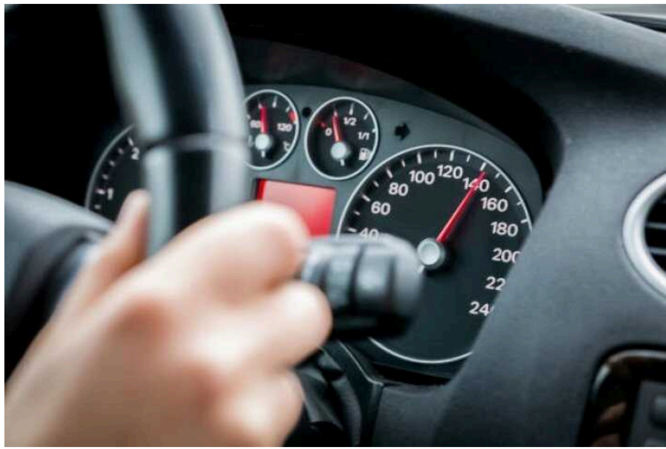
Водіям хочуть посилити відповідальність за шини та перевищення швидкості

Законопроект із відповідними пропозиціями зареєстрували у ВР.