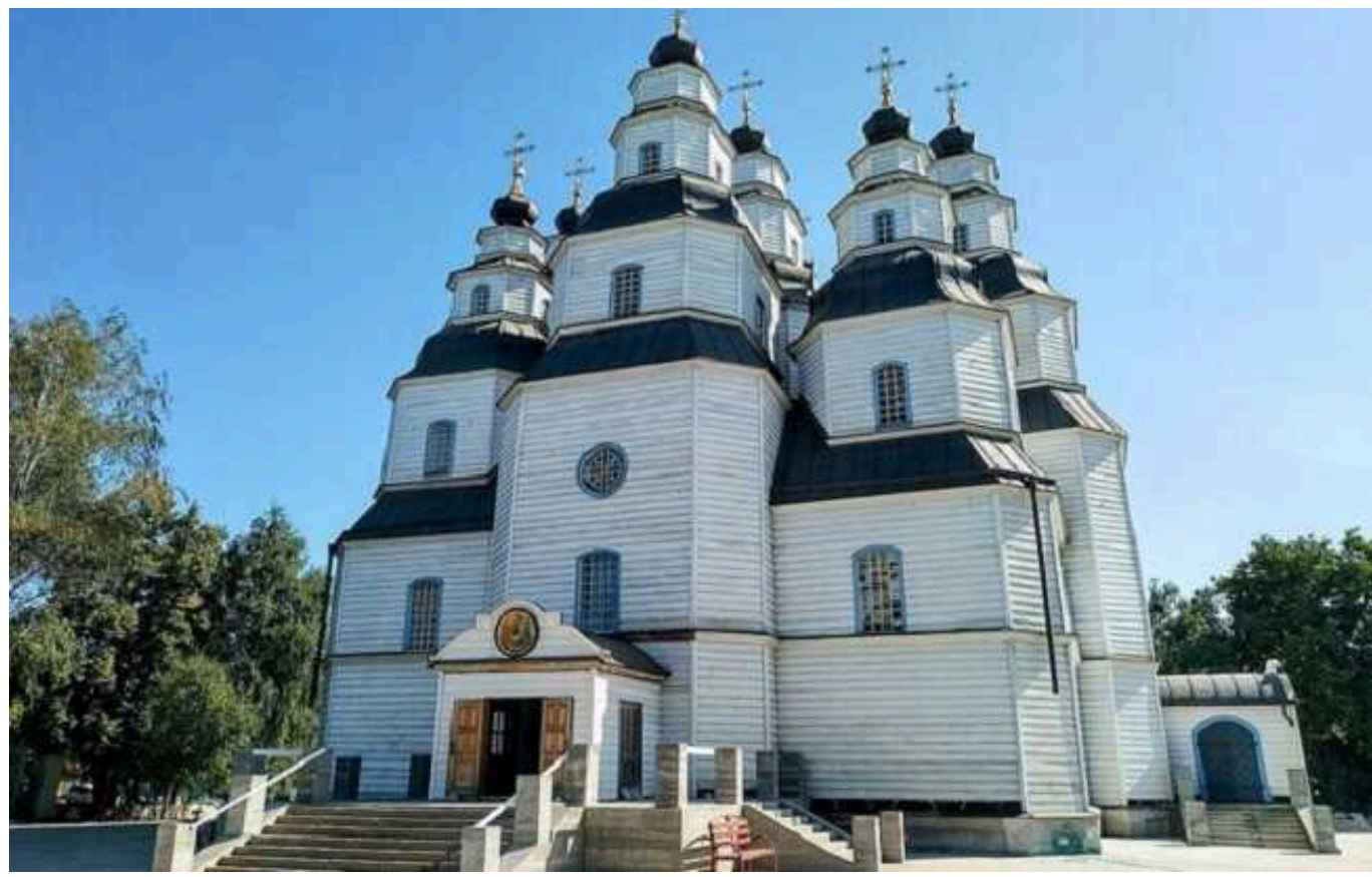
Комітет ВР дозволив перейменувати Новомосковськ і Южноукраїнськ

Комітет Верховної Ради з питань організації державної влади ухвалив рішення про перейменування міст Новомосковськ і Южноукраїнськ.