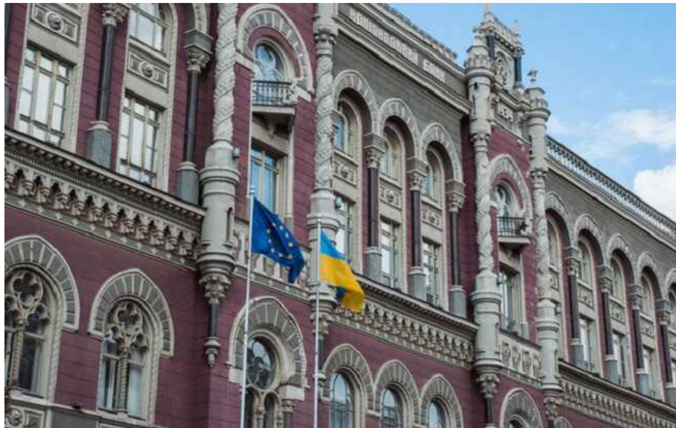
НБУ посилив правила купівлі валюти

Від 21 лютого 2024 року Національний банк України (НБУ) здійснив оптимізацію для деяких валютних обмежень. Це означає, що на валютному ринку зміняться правила купівлі валюти бізнесом і розрахунки за експортними операціями.