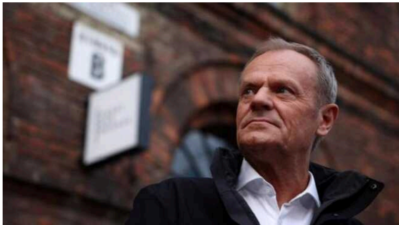
Туск назвав дату, коли Україна та Польща зустрінуться через блокаду кордону

Україна та Польща зустрінуться у Варшаві для вирішення питання блокади кордону, яка вже триває майже два тижні. Зустріч відбудеться 28 березня.