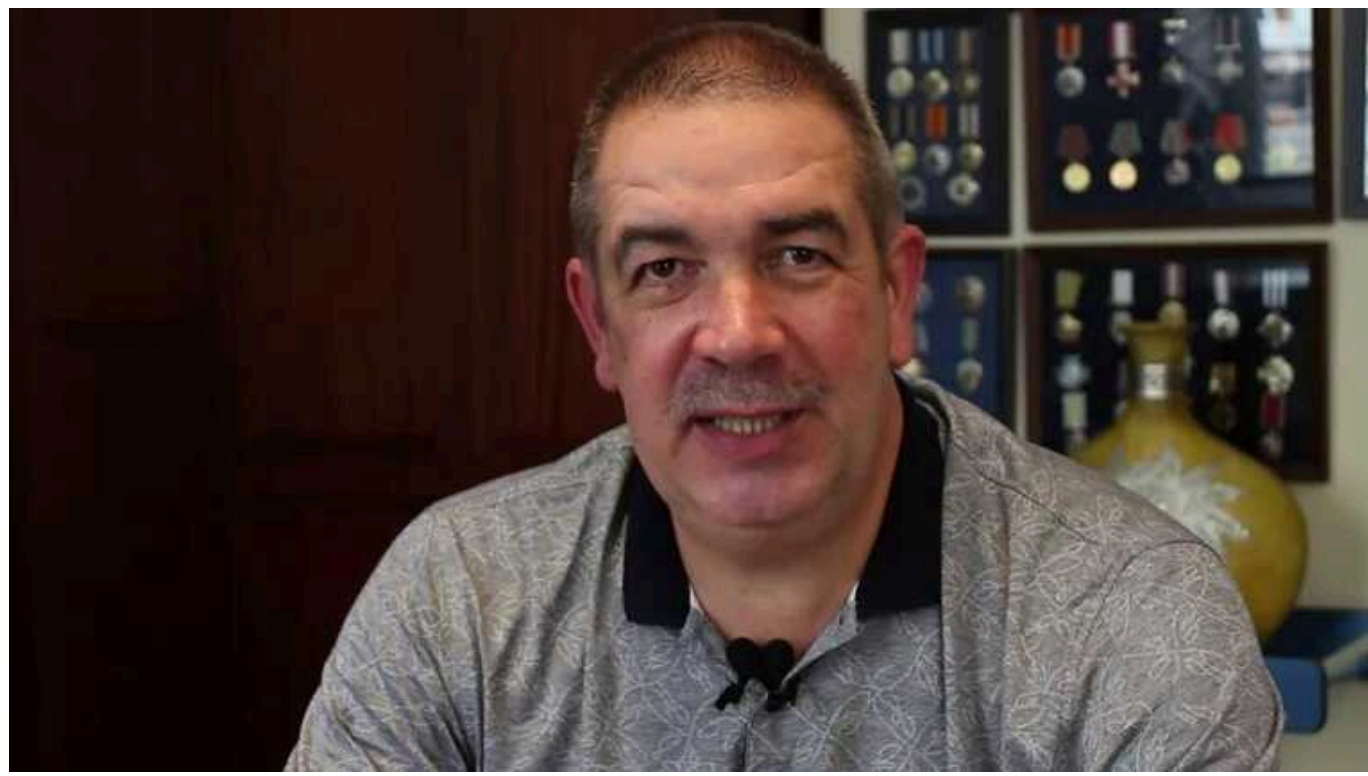
Від "регіонала" до "смотрящого": ексчлен "Партії регіонів" розширює вплив в Україні

Він – успішний, багатий, публічний діяч на терені України. Його охоронна імперія добре розвинена та надає послуги великій кількості людей та бізнесу. Він має впливових друзів серед політиків та чиновників. Він веде розкішне життя, а його діти живуть за кордоном. Але за блискучою фасадом ховається брудне минуле, тіньові схеми та зрада національних інтересів.