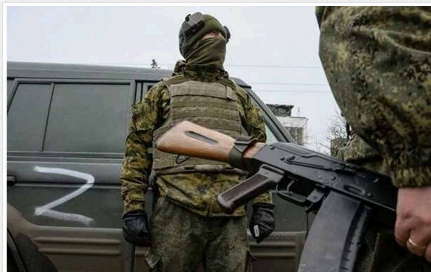
Партизани "Атеш" показали фортифікації окупантів у Криму

Ворожі фортифікаційні споруди розташовані у селі Окунівка. Партизани закликали росіян "акуратніше ходити", оскільки на об'єкті їм залишили "подарунки".