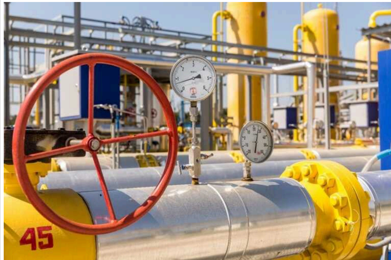
Bloomberg: Трейдери сподіваються, що Україна продовжить транспортувати газ із Росії

Єврокомісія вважає, що навіть держави-члени, які найбільше залежні від російського газу, зможуть пережити повне припинення поставок з Росії.