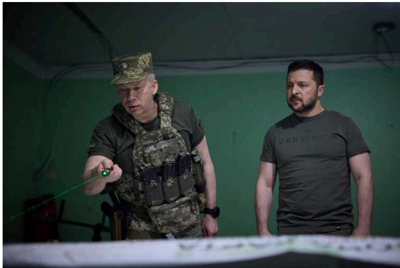
Сирський готує аудит армії: в ЗСУ є військові, які досі не були на фронті

Головнокомандувач ЗСУ Олександр Сирський "готує великий аудит" армії. Таку заяву зробив Президент України Володимир Зеленський на зустрічі зі своєю фракцією "Слуга народу" 21 лютого.