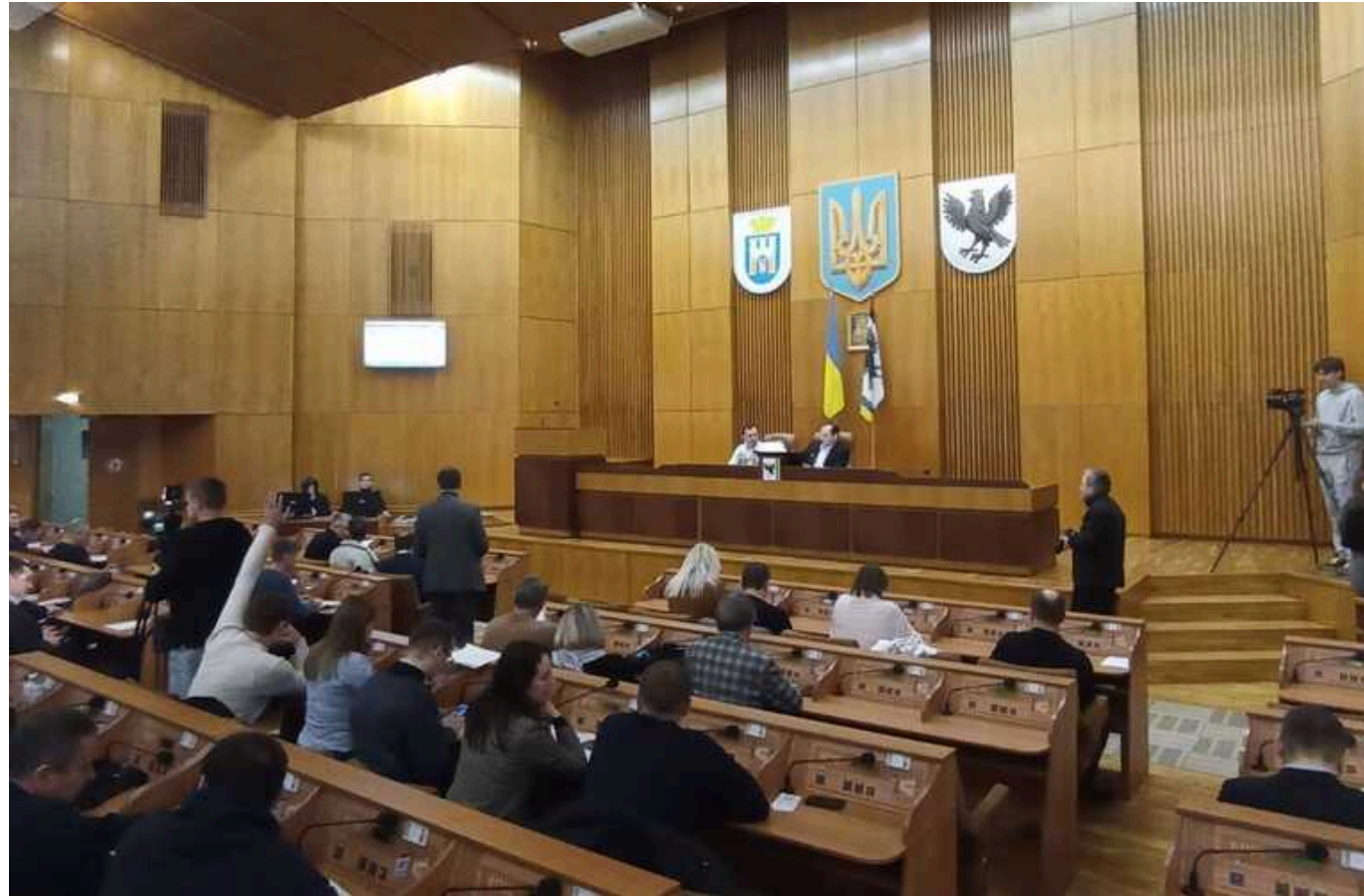
Міносвіті попросили не об'єднувати університети в Івано-Франківську

Івано-Франківська міська рада звернулась до Міністерства освіти та науки України з проханням не об'єднувати місцеві університети. Зокрема, питання стосується реорганізації Прикарпатського національного університету ім. Стефаніка, Івано-Франківського національного університету нафти і газу та Івано-Франківського національного медичного університету.