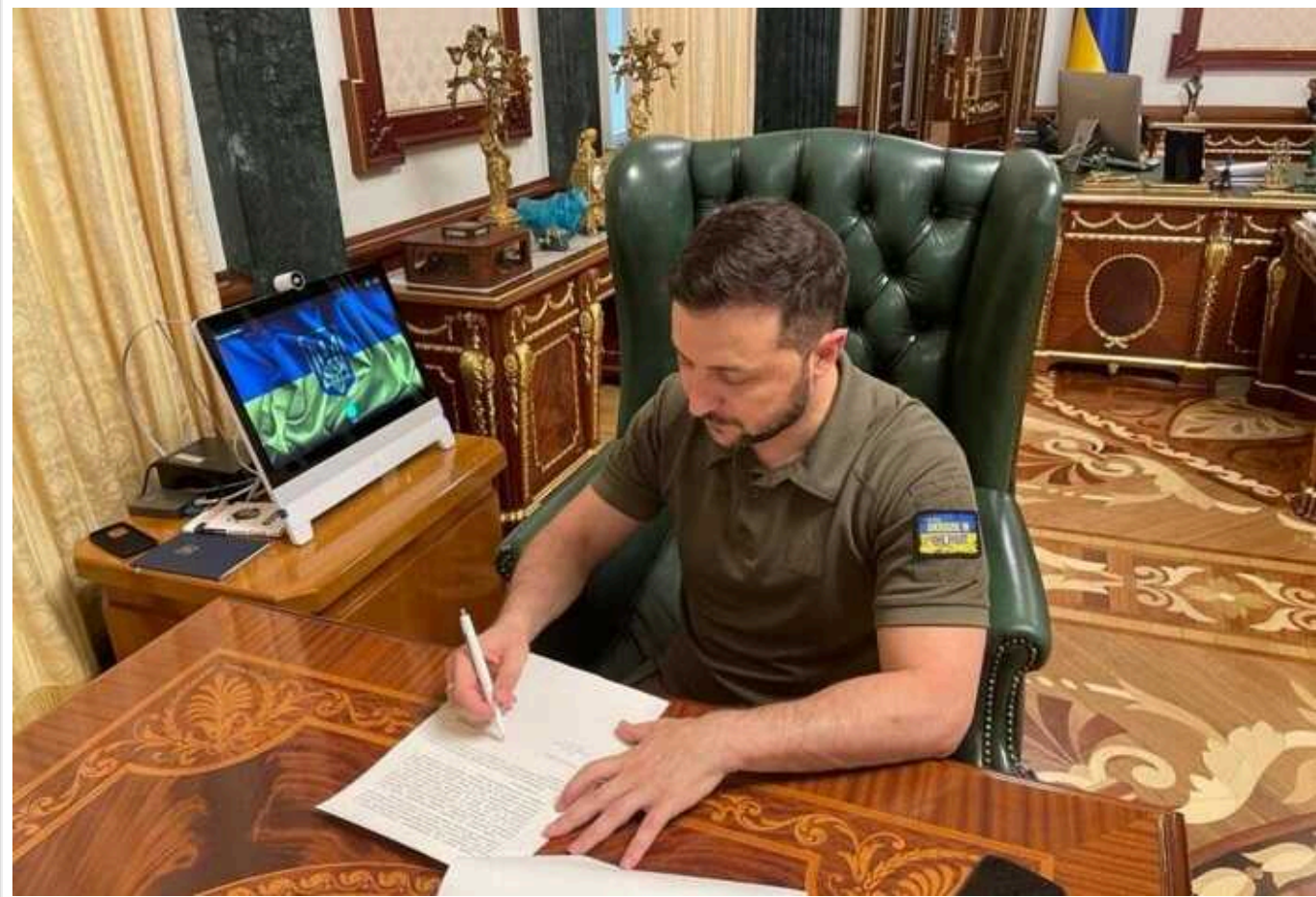
Іноземцям та людям без громадянства дозволили служити у Нацгвардії України

Президент Володимир Зеленський підписав указ, яким дозволив іноземцям та особам без громадянства вступити на службу до Національної гвардії.