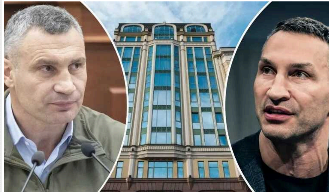
Як стоїтний будинок у центрі Києва став кухнею для готелю Кличків

На одній з наближчих сесій Київради мер столиці Віталій Кличко може дозволити своєму брату – Володимирі забрати землю під стоїтним будинком, який використовувать для розміщення кухні їхнього готелю «11 Migrgs».