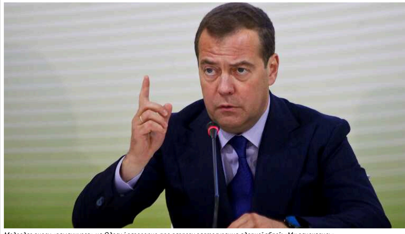
Медведєв знову «замахнувся» на Одесу і заговорив про загрозу застосування ядерної зброї: «Ми зачекались»

Заступник голови Радбезу Росії та колишній президент країни-агресора Дмитро Медведєв знову заговорив про загрозу застосування ядерної зброї. Крім того, російський політик розмірився про українське місто Одесу.