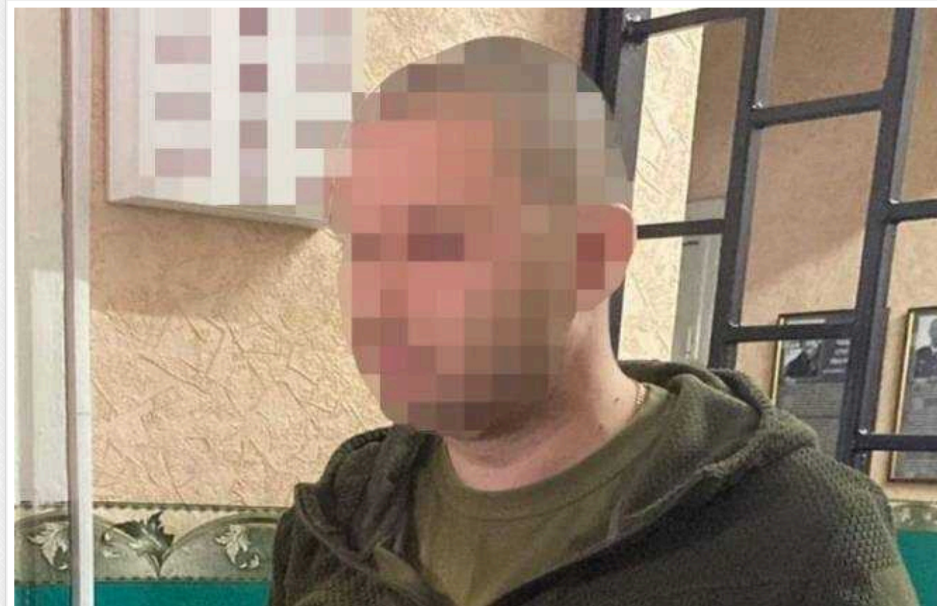
На Полтавщині за корупцію затримали керівника районного військомату

Начальнику одного з районних військоматів Полтавщини вручили підозру в одержанні неправомірної вигоди за вчинення протиправних дій з використанням наданої влади та службового становища. Як повідомляє СБУ, посадовець вимагав хабарі від представників місцевого бізнесу за відтермінування від мобілізації – у вигляді грошей або пального.