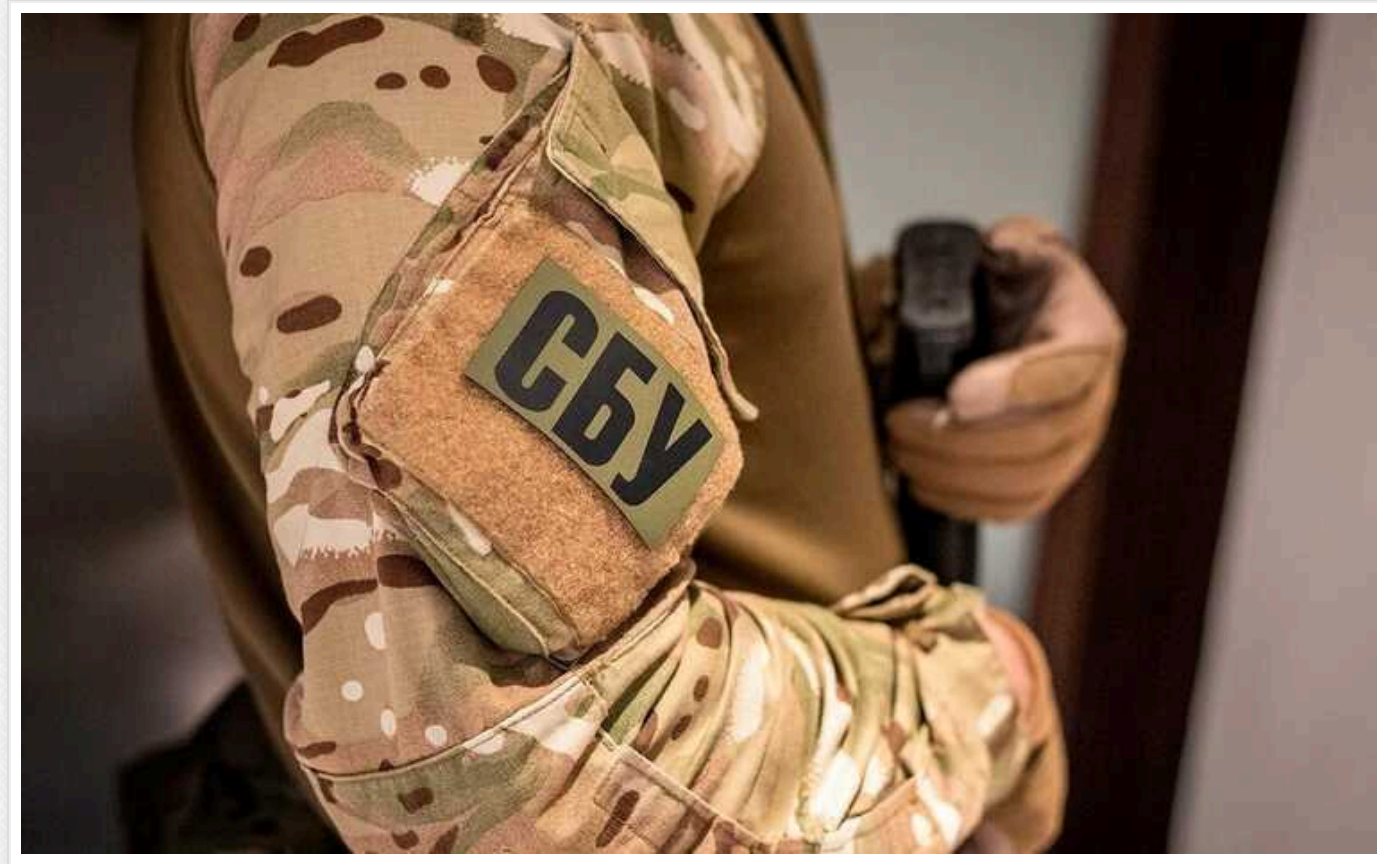
СБУ оголосила підозри двом окупантам: вивозили автомобілі з-під Києва до Білорусі

Правоохоронці оголосили підозри двом росіянам, які під час окупації частини Київської області вивозили автомобілі на територію Білорусі.