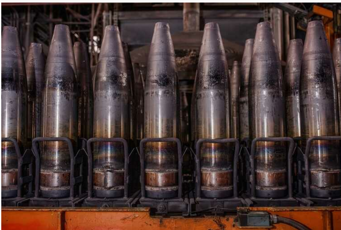
Канада виділить кошти на постачання десятків тисяч снарядів із Чехії в Україну

Канада планує надати кошти на ініціативу Чехії щодо постачання великої кількості артилерійських снарядів до України.