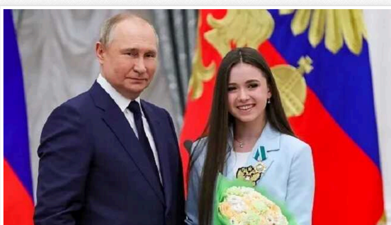
Путін з'явився на відкритті турніру вперше зі своєю "новою коханкою"

Президент Росії прийшов на церемонію відкриття турніру "Ігри Майбутнього" у Казані разом із фігуристкою Камілою Валієвою. 17-річна спортсменка сиділа ліворуч від кремльського диктатора.