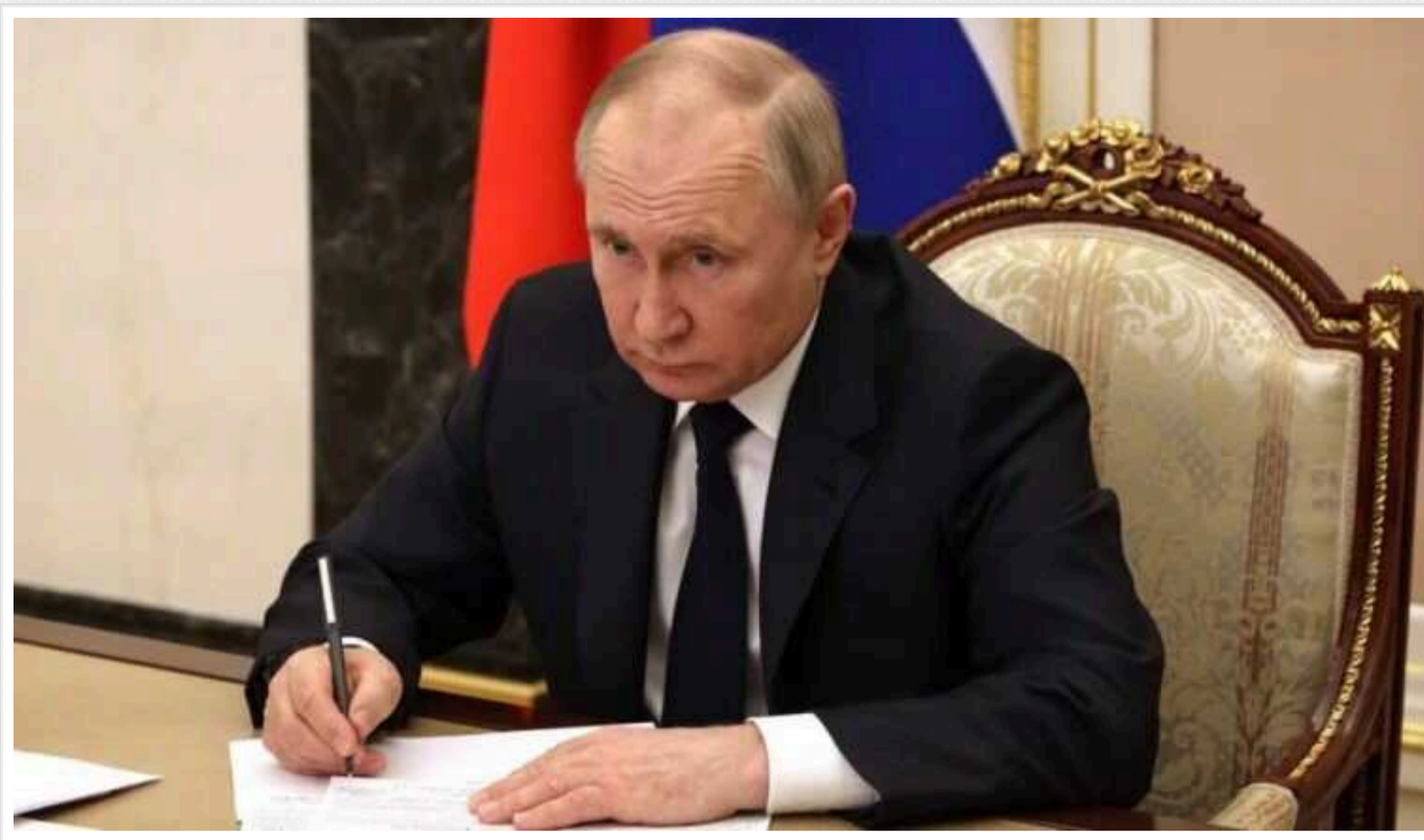
Путін на відкритті "Ігор майбутнього" заявив про велич Росії та став посміховиськом у мережі

Президент Росії Володимир Путін взяв участь у церемонії відкриття у Казані фіджитал-турніру "Ігри Майбутнього", що відбудеться з 21 лютого до 3 березня. У своїй промові ватажок Кремля заявив, що РФ "залишається однією з провідних спортивних держав".