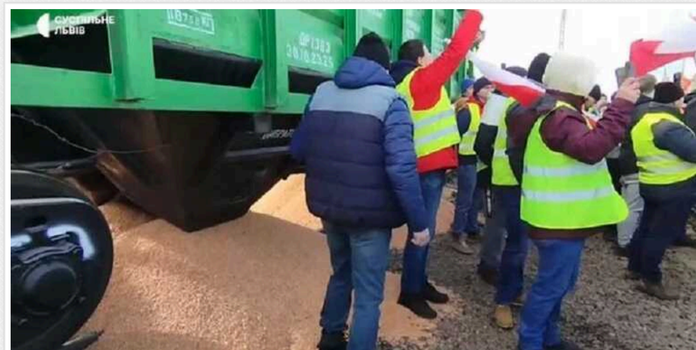
Через Польщу може проходити більше російського зерна, ніж українського - Кульпа

Польські фермери блокують рух українських вантажівок і незадоволені транзитом українського зерна. При цьому потік російського зерна через Польщу може бути більшим, аніж український.