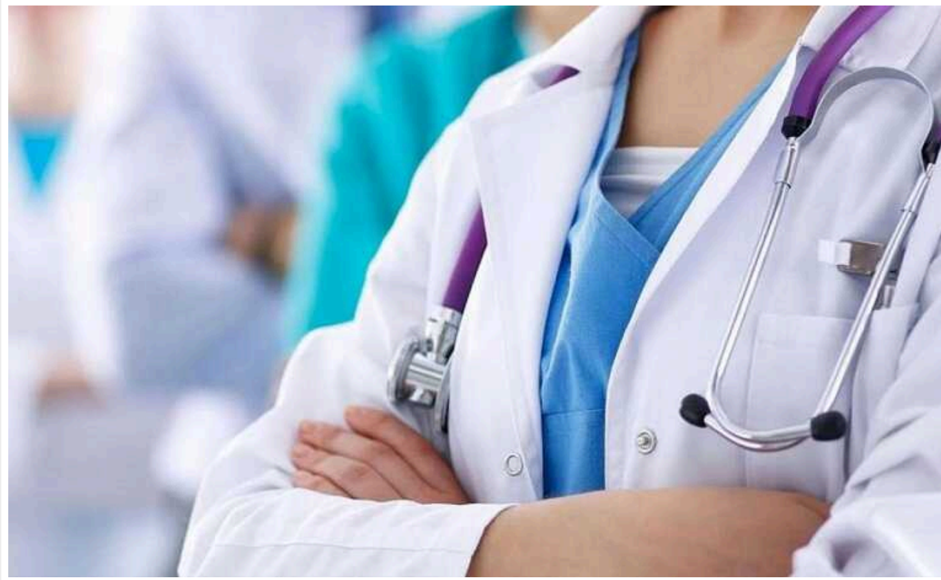
В одному з столичних готелів зафіксували спалах сальмонельозу

В одному з готелів Києва зафіксували спалах гострої кишкової інфекції (сальмонельозу). Внаслідок вживання страв з яєць захворіло десять осіб, серед яких є іноземці.