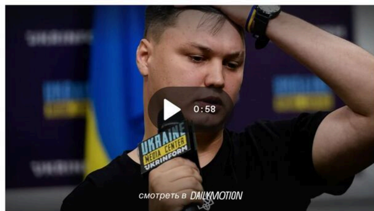
Maxim Kuzmínov, el piloto desertor ruso asesinado en Alicante que era un héroe para Ucrania