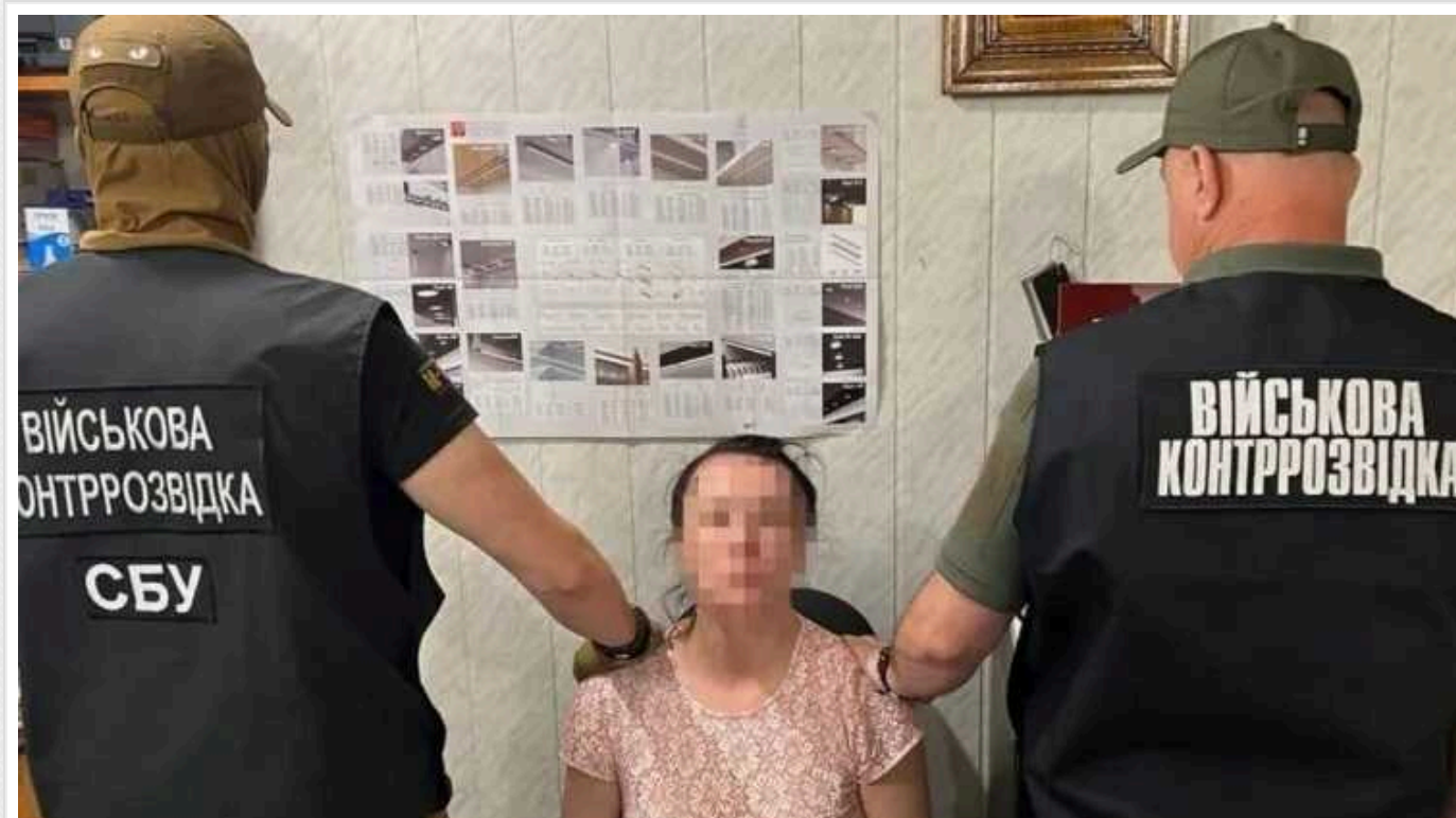
Агентка ФСБ отримала 15 років тюрми: коригувала вогонь по Кривому Рогу

Мешканку Кривого Рогу засудили до 15 років ув'язнення за співпрацю з ФСБ Росії та коригування вогню по рідному місту. Вона збирала дані про розташування ЗСУ та передавала їх російським кураторам.