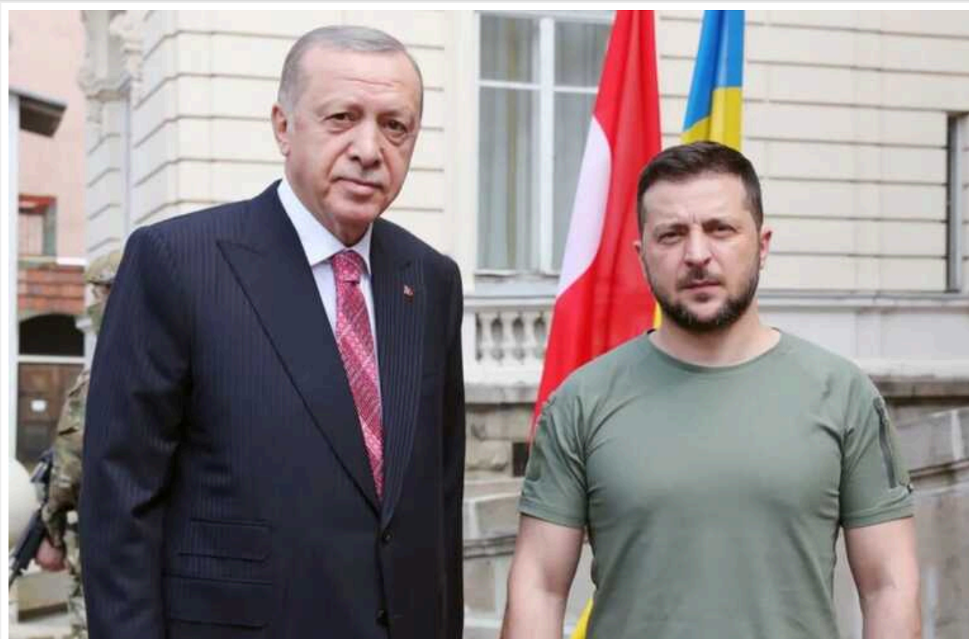
Зеленський може зустрітися з Ердоганом найближчим часом, – турецькі ЗМІ

Президент України Володимир Зеленський незабаром може зустрітися зі своїм турецьким колегою Реджепом Тайпом Ердоганом. Останній вже отримав відповідне запрошення під час візиту до столиці Туреччини Анкари прем'єр-міністра Албанії Еді Рами.