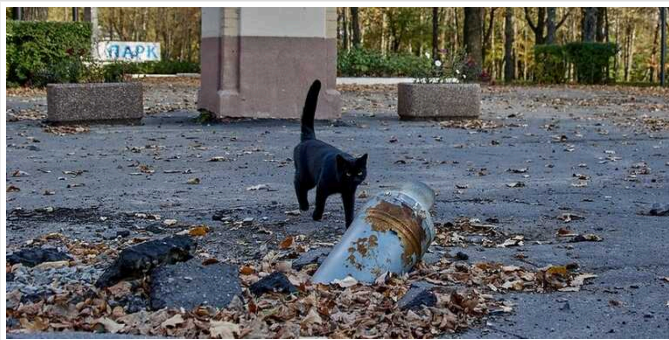
У Харківській області в одному із селищ запровадили карантин через сказ

Фахівці зафіксували випадок сказу у домашнього kota у селищі Золочів Харківської області. Там запроваджено карантин.