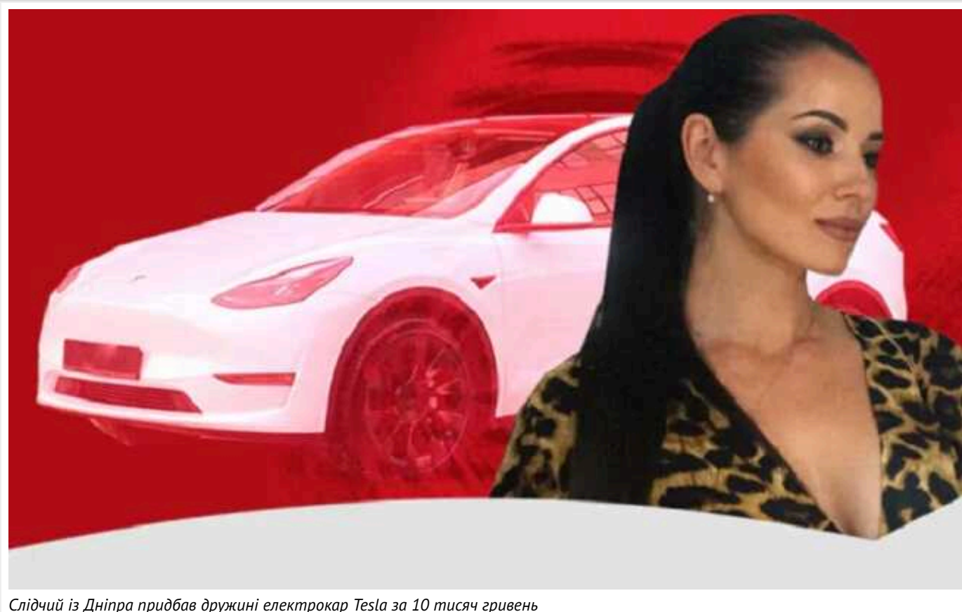
Слідчий із Дніпра придбав дружині електрокар Tesla за 10 тисяч гривень

У середньому Tesla Model Y 2022 випуску на вторинному ринку стартує від 30 тисяч доларів.