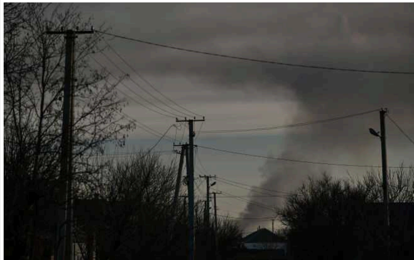
Обстріл Добропілля: окупанти вдарили по гуртожитках із переселенцями з Бахмута та Донецька

Російські війська сьогодні вночі за допомогою "Шахедів" атакували гуртожитки у Добропіллі Донецької області. У них мешкали переселенці з Бахмута, Лисичанська та Донецька.