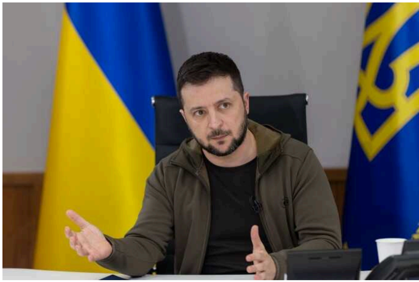
Зеленський вперше за 2 роки зустрівся із фракцією "Слуга народу"

Сьогодні, 21 лютого, український президент Володимир Зеленський уперше з початку повномасштабного вторгнення провів зустріч із фракцією "Слуга народу".