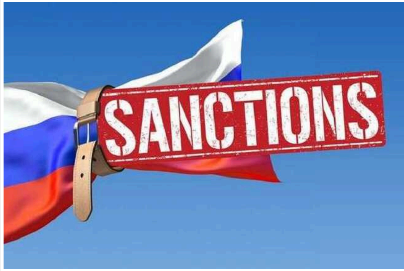
13 пакет санкцій проти РФ: націлений на близько 200 чиновників та організацій

Стали відомі деталі 13 пакетів санкцій проти Росії.