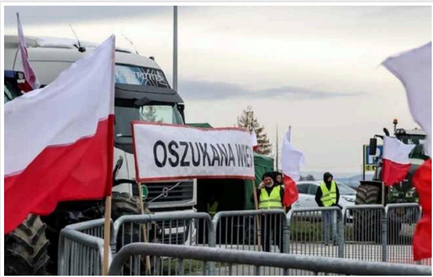
Чим обернуться для України протести на кордоні з Польщею: надія на Словаччину та Угорщину

Загальний страйк фермерів загострив ситуацію на українсько-польському кордоні: за шістьма напрямками у чергах стоїть до 2500 вантажівок. При цьому Варшава не вирішує проблеми, а хоче запровадити нові обмеження. ЗМІ розбиралися, які шляхи залишаються для імпорту та експорту товарів до України.