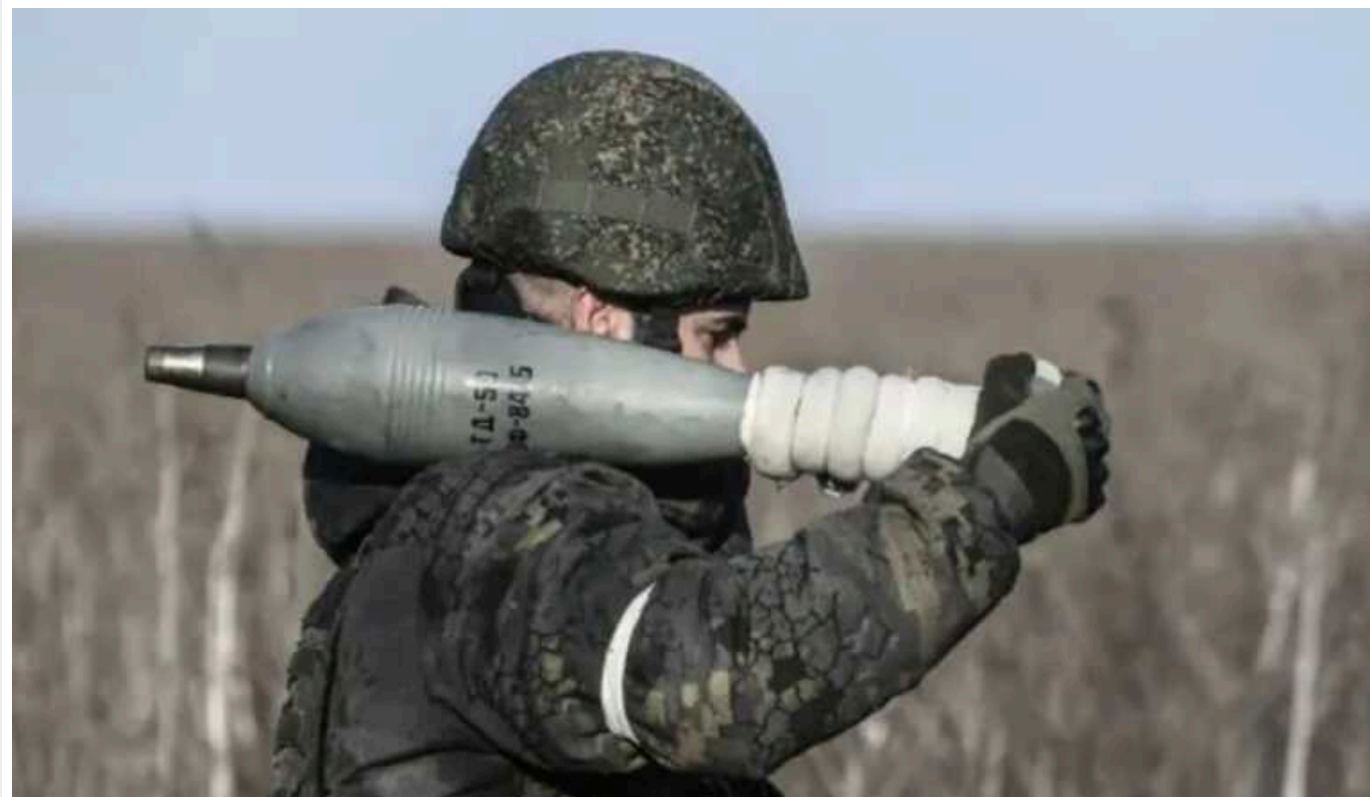
Росія не виробляє достатньо боєприпасів для війни: на що сподівається Кремль, — Reuters

Російська промисловість втратила доступ до західних компонентів, необхідних для випуску зброї. На думку західного чиновника, санкції все ж таки вплинули на РФ.