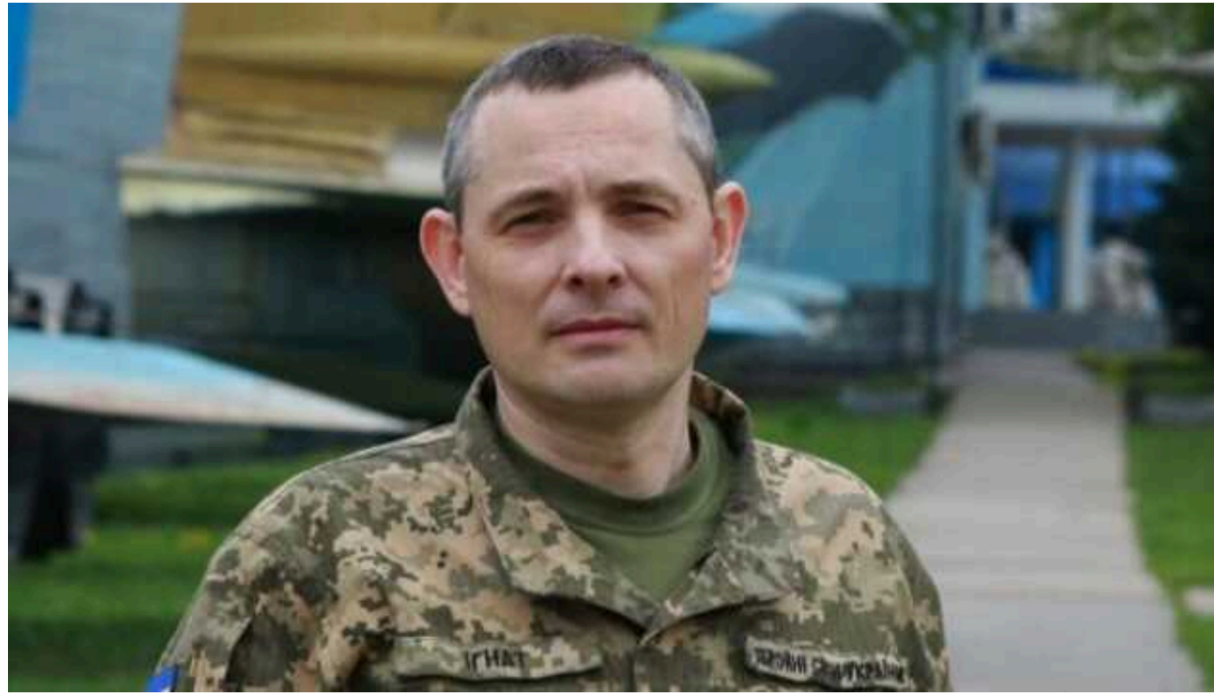
У Повітряних силах пояснили, чому авіація РФ "губить" бомби, не долітаючи до України

Російські літаки часто "гублять" бомби ще на території РФ, не підлетівши до України. Також при пусках ракет з літаків Ту-95 снаряди падають у Каспійське море, де вже багато їх "плаває".